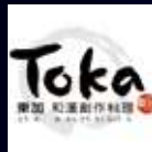
東加和漢創作料理