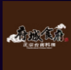
府城食府正宗台南料理