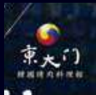
東大門韓國烤肉料理館