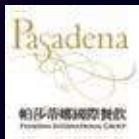
帕莎蒂娜台南歸仁店