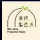
幸福製造所x小覓秘